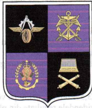
Fig. 1 și 2 Emblema Asociației Cadrelor Militare în Rezervă și în Retrageră din Logistica Armatei "General Constantin Zaharia"